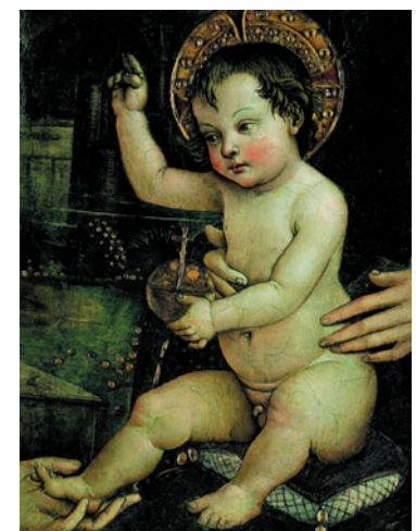
CAPOLAVORO «Il Bambino Gesù delle mani» restaurato sarà esposto a Perugia dal 16 settembre

che verrà esposta a Perugia dal prossimo 16 settembre in occasione della mostra Artevita , grazie alle indagini di Franco Ivan Nucciarelli, che del Pinturicchio è uno dei massimi esperti, ci consente quindi non solo di porre nuova attenzione sulla squisita produzione dell'artista che seppe infondere ineguagliato virtuosismo alle sue pitture svelando una maestria degna di un eccelso miniaturista